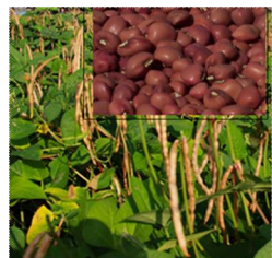
Variação do Preço de Feijão Nhemba no Mercado Retalhista: O preço do feijão nhemba

ao retalhista nos mercados monitorados pelo SIMA na presente semana estão estáveis, no entanto, alguns mercados apresentam oscilação de preço com maior tendência a subir como ilustra o Quadro 3b. No quadro 2 ve-se os mercados que variaram o preço desta leguminosa.