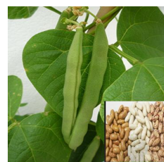
Variação do Preço de Feijão manteiga no Mercado Retalhista: O preço a retalho do feijão

manteiga na presente semana estão estáveis apesar da subida de (16.67%) nos mercados de Manhiça e Cidade de Quelimane, e de (2.44%) no mercado de Morrupula; e uma ligeira descida no mercado da Cidade da Matola (6.90%). O mercado da Cidade de Quelimane vendeu esta leguminosa na semana anterior a 60,00Mt/kg contra 70,00Mt/kg na presente semana, O mercado da vila de Manhiça vendeu a 86,61Mt/kg contra 101,04Mt/kg, o mercado Morrupula vendeu a 68,33Mt/kg contra 70,00Mt/kg, e o mercado da Cidade da Matola vendeu a 65,66Mt/kg contra 61,13Mt/kg.